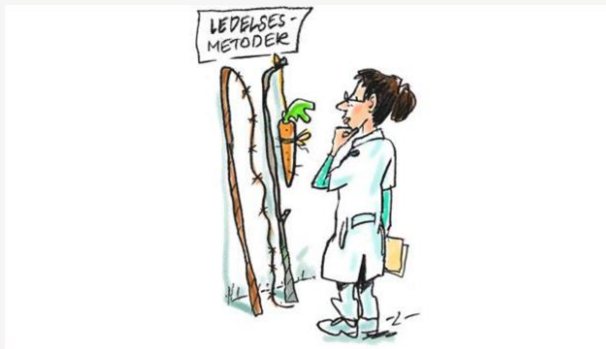
Illustration: Lars-Ole Nejstgaard